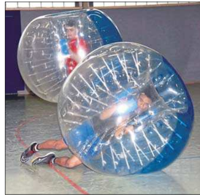
Bubble-Ball war die lustige Disziplin am letzten Schultag an der Pauli Hauptschule.